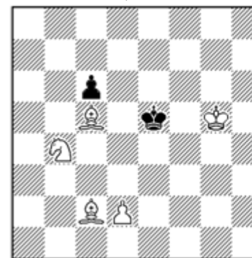
Matt in 7 Zügen (5+2)