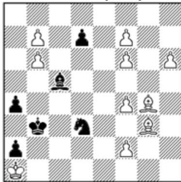
Weiß gewinnt (10+6)