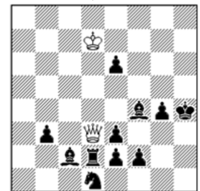
Hilfsmatt in 2 Zügen (2+11) a) Diagramm b) wKd7-->h7

Kennen Sie eine tatsächlich gespielte Schachpartie, in der eine Läuferunterverwandlung in der Form vorkommt, dass nur durch diese Unterverwandlung der